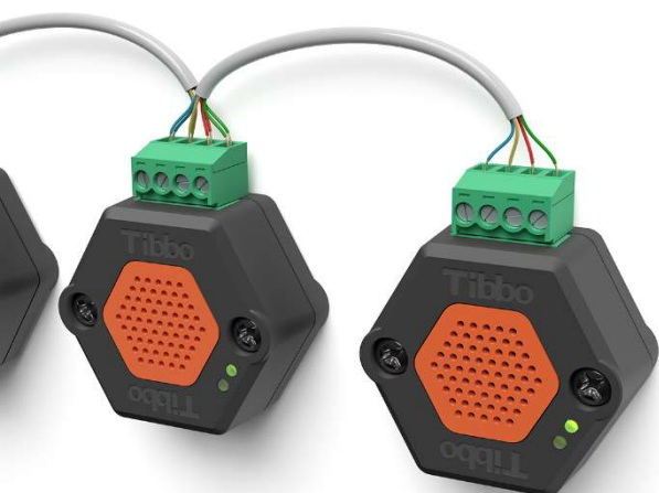
גודל החיישן: 4 X 4.5 X 2 ס"מ

T2T-BP-1P תוספת סוללת גיבוי 4.5Am/h לדגם תוספת יציאת ממסר מגע יבש למתח נמוך